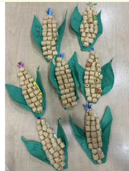
언어/미술: 앵두콘으로 옥수수 알갱이 표현하여 옥수수 꾸미기