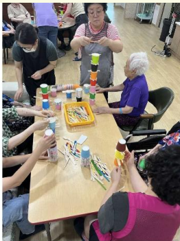
동화/회상: 동화 내용에 대해 회상하고 컵 쌓기 게임하기

기타 문의 및 상담: 사무실 031)559-9495, 원장 010-8758-9032