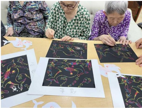
언어/ 미술: 바닷속 풍경 그리기

기타 문의 및 상담: 사무실 031)559-9495, 원장 010-8758-9032