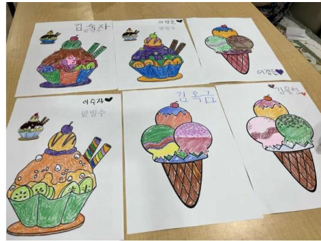
생각꾸미기: 틀린 그림 찾기/ 빙수꾸미기