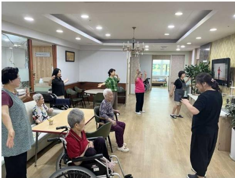
실버체조: 신체기능 훈련