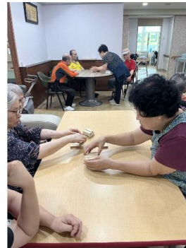
치매예방: 젠가 탐색